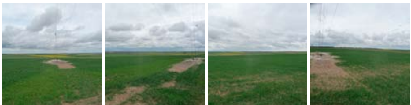
Blick in Richtung Norden

Errichtet wird der Windpark ca. 35 km südöstlich der Stadt Reims auf einem leichten Hochplateau. Weder Wald, noch Industrie oder eine größere Ansiedlung finden sich in unmittelbarer Nähe. Über die angrenzenden Felder kann der Wind damit ungehindert zu den Kraftwerken wehen.